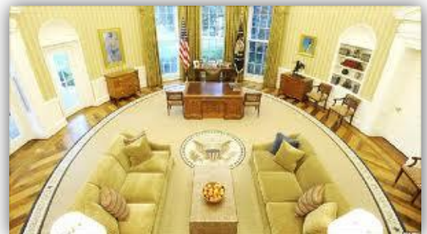
Le célèbre bureau ovale du président

On trouve même une piste d'atterrissage pour l'hélicoptère du président, au milieu du jardin.