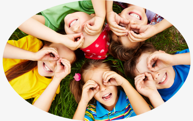
Document créé par la CCGCPA et imprimé par Heliocom - Ne pas jeter sur le voie publique

La Communauté de Communes de Gâtine et Choisilles Pays de Racan vous propose des solutions pour l'accueil des enfants et des jeunes sur l'ensemble du territoire.